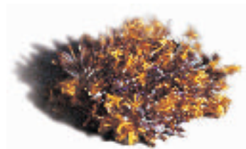
16- FONTAN Marie-Noëlle Née en 1948 En friche Etaorines de Protea, lin, coton tissés 5 x 12 x 12 cm.