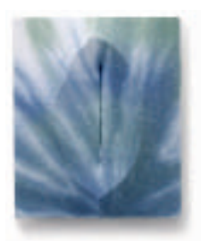
15-OGAWA Noriyo A plant the nuno (cloth) family (Une plante de la famille textile) Technique personnelle Coton, bois, plastique 15 x 18 x 2 cm.