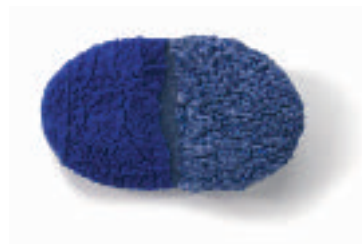
24-TANAKA Misako Oval profile (Profil oval) Feutre, couture à la machine Laine, tissu, papier 20 x 13 x 3 cm.