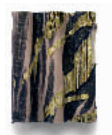
5-HORIE Tadashi Jikken 0502 (Expérimentation 0502) Murakumo shibori Coton, polyester 18 x 22,5 x 15,7 cm.