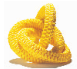
55- NIO Keiji Né en 1957 Yellow Ground – terre jaune Bande en nylon, coloré, tressé 12 x 12 x 12 cm.