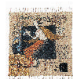
43- LUKAZA Velga Née en 1960 Le jardin des délices Lin, coton, soie, fil d'or, perles, broderie main 12 x 12 cm.