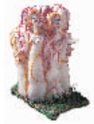
32- JILL GALLIENI Née en 1948 Écllosion de valérianna olitoria Soie sur mousse, sculptée, brodée, cousue 12 x 6,30 x 7,30 cm.