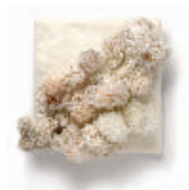
6-ISHIHARA Tomoko White form (Forme blanche) Technique personnelle Soie, résine 20 x 12 x 20 cm.