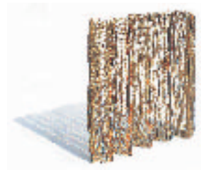
54- NIMKULRAT Née en 1974 Dimension EX N° 2 Fil métallique en cuivre, nylon, laine, tissés 12 x 12 x 2 cm.