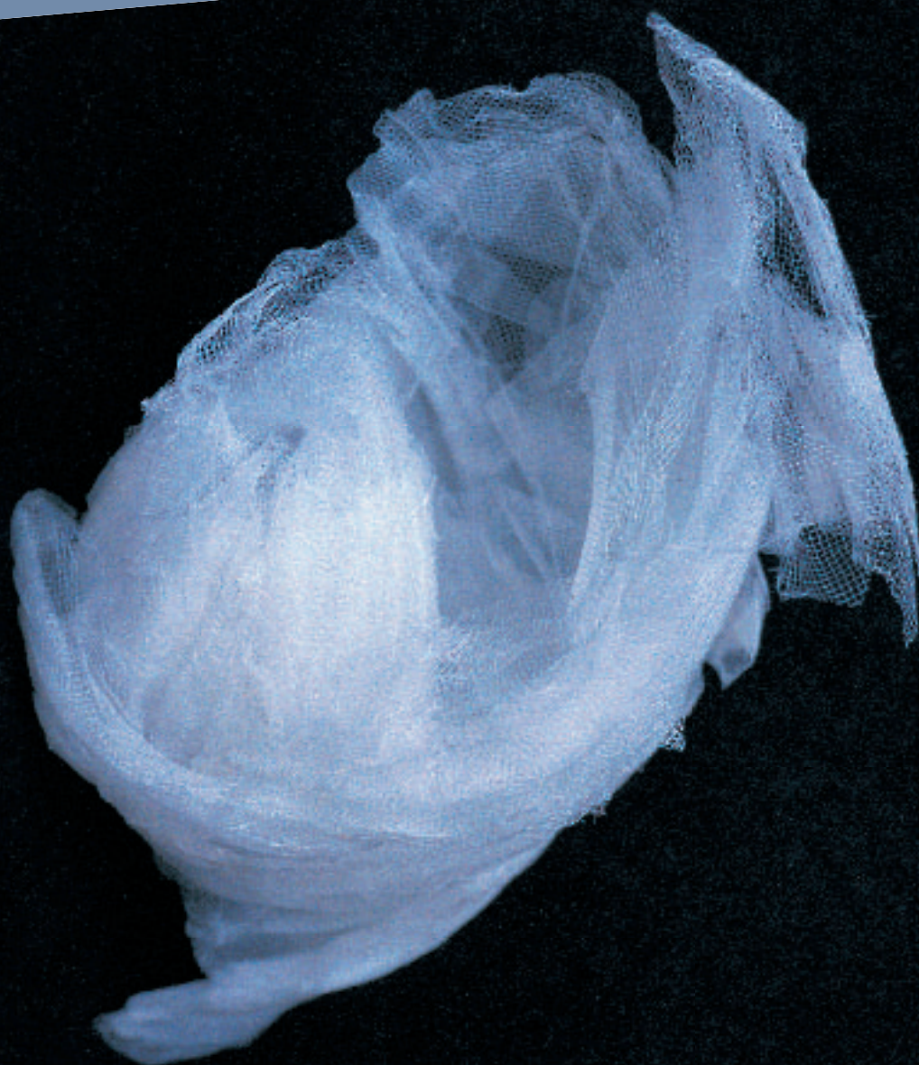
Hara, "Seed in the prosperous day"

Musée Jean Lurçat et de la tapisserie contemporaine d'Angers 10 décembre 2005 / 14 mai 2006