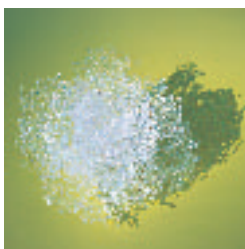
58- PINCEMAILLE Sandrine Née en 1966 Salade au jardin Fil de colle, technique personnelle 7 x 12 x 12 cm.