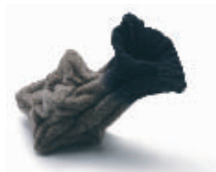
18-OKAMOTO Yasuko Root (Racine) Shibori, travail de feutre Laine 20 x 20 x 20 cm.