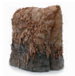
3-FUJIOKA Keiko Née en 1940 Scent of time (Le parfum du temps) Technique personnelle Collagène, sachets de thé 17 x 20 x 17 cm.